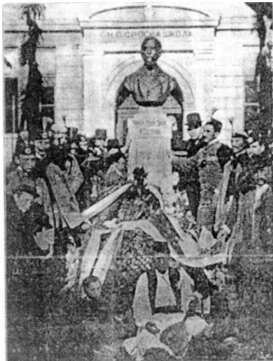
Са свечаној одшарања Змијевој споменику у Руми. www.toparblja.com